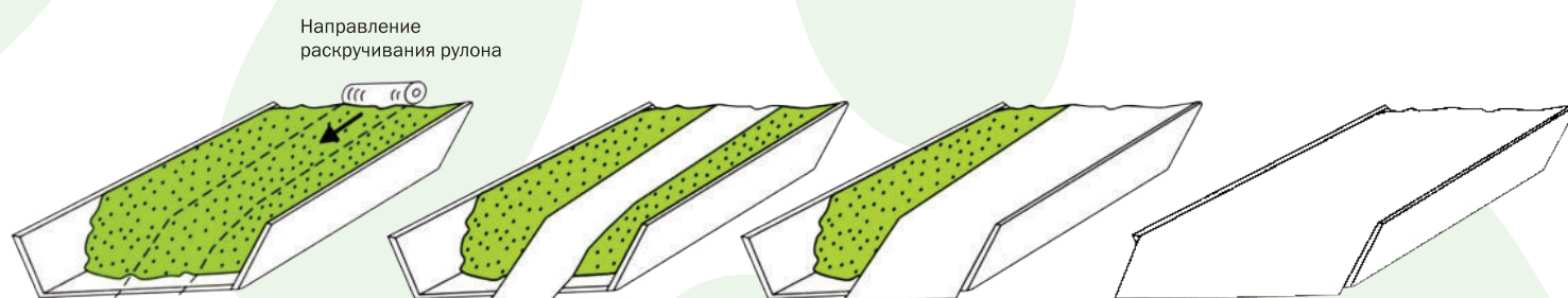
Схема укрытия сенажных (силосных) траншей и ям широкоформатной пленкой

1 Уложить рулон пленки наверх по центру траншеи